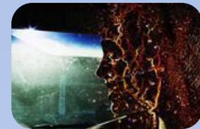
Napalm & Wagner